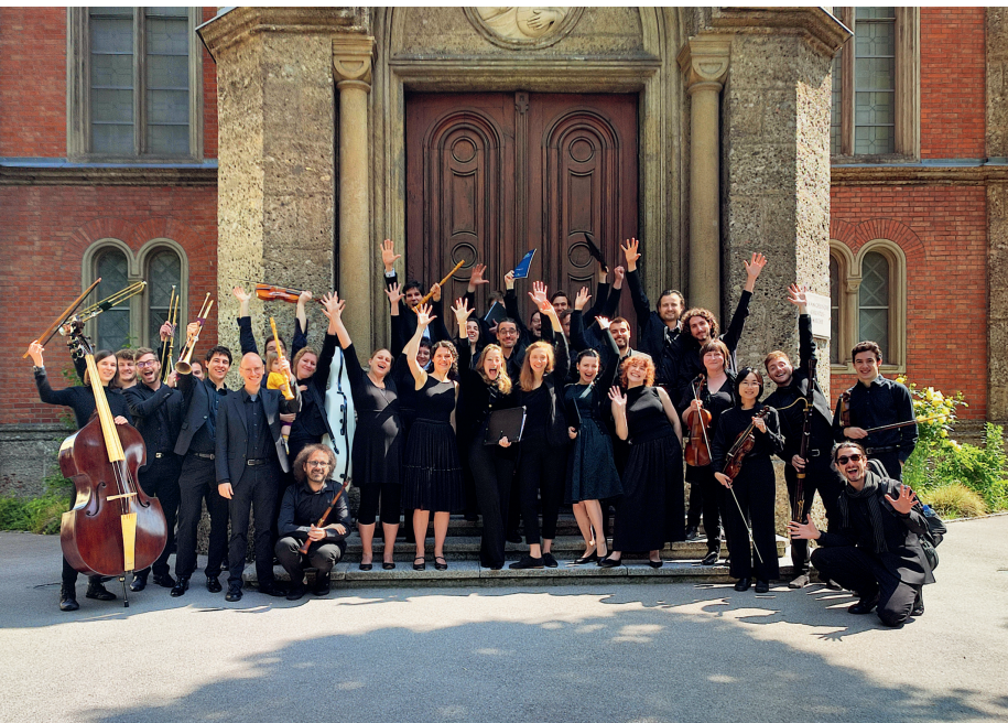
Ensemble BachWerkVokal MDG 923 2315-6 (Hybrid-SACD)